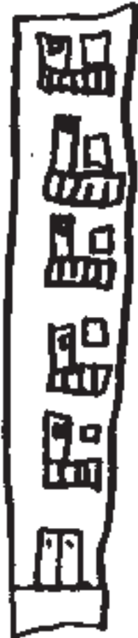
to - ren - flat

Een variatie hierop: laat uw kind hinkelen, een blokje neerleggen of een rondje kleuren bij elke lettergreep, bijvoorbeeld: